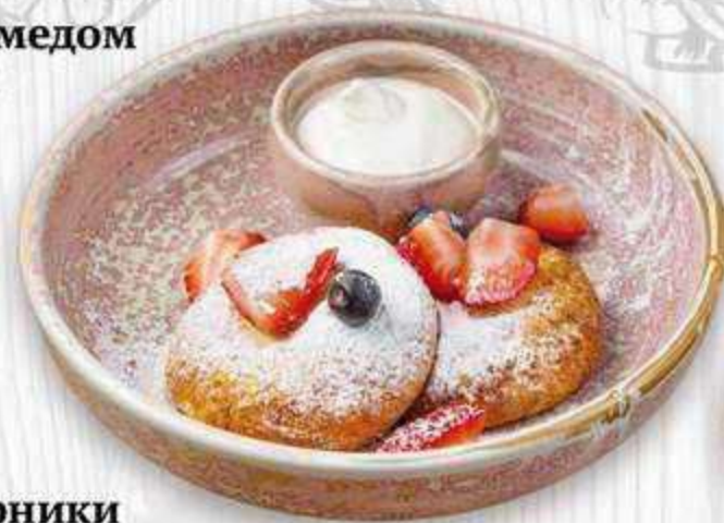
Сырники с клубничным йогуртом или сметаной 110/50/20 г. | 550 ₺