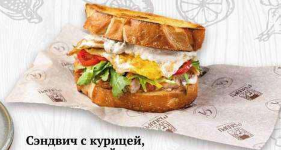
Сэндвич с курицей, томатами и яйцом 350 г. | 590 ₺