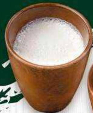
Мацони 250 г. | 290 ₺