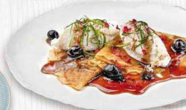
Блины с творогом, кедровыми орехами и вареньем из кизила 200 г. | 490 ₺