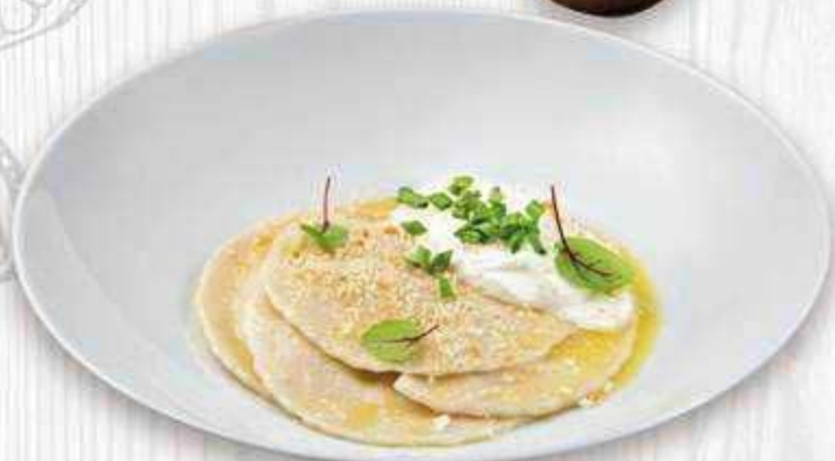
Квери с копченым сулугуни и сметаной 160 г. | 390 ₺