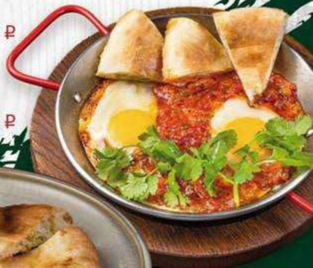
Яичница глазунья 150/60 г. | 300 ₺