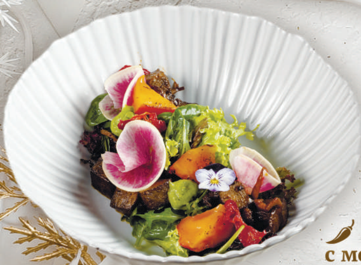
Теплый салат с телячьим языком, хурмой и арбузной редькой 160 г. | 750 ₺