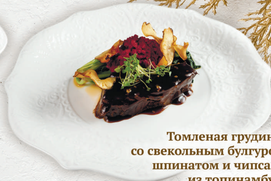
Томленая грудинка со свекольным булгуром, шпинатом и чипсами из топинамбура 220 г. | 900 ₺