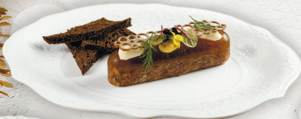
Холодец с бычьими хвостами 150 г. | 600 ₺