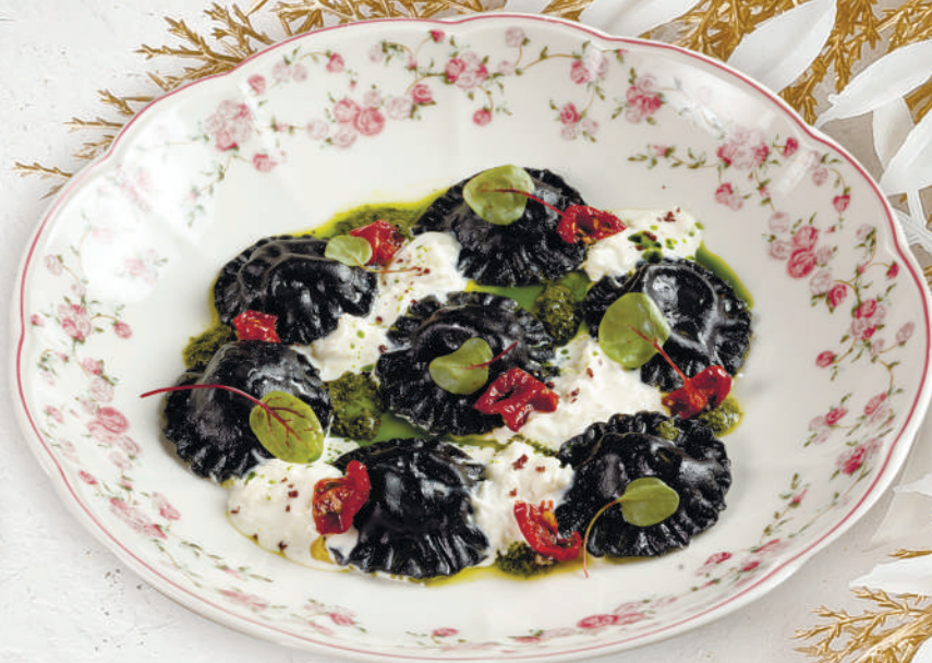
Равиоли с гребешком, страчателлой и вялеными томатами 200 г. | 900 ₺