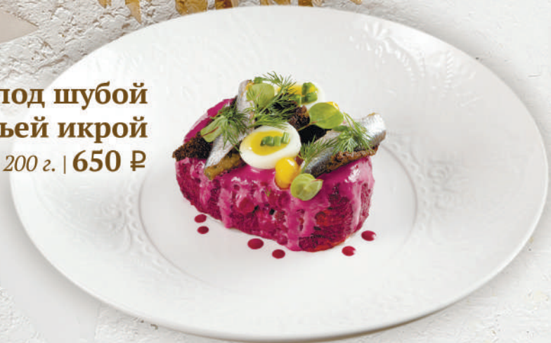
Сельдь под шубой с щучьей икрой 200 г. | 650 ₺